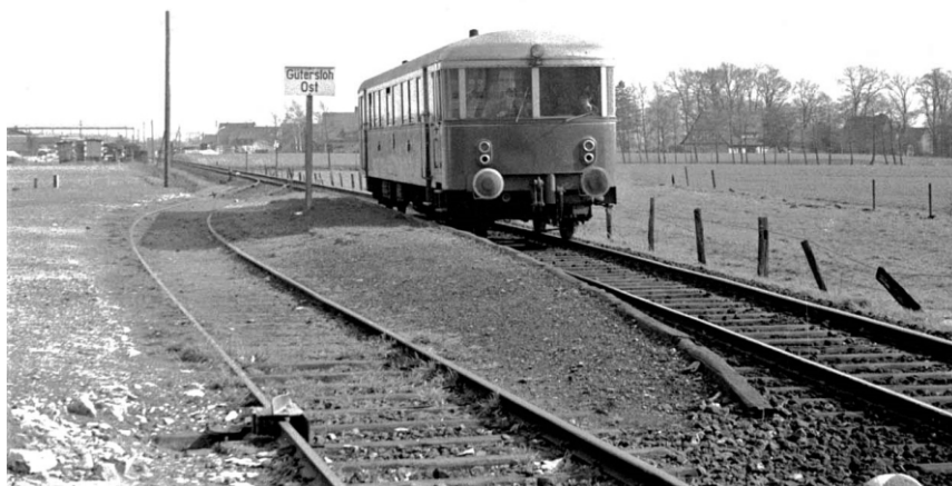
Hinter der Gaststätte Konkurens (früher Ortswirth) befand sich damals der Bahnhof Gütersloh Ost. Ursprünglich lautete der Name Bahnhof Sundern, dies führte aber regelmäßig zu Verwechslungen mit dem Bahnhof der gleichnamigen Stadt im Sauerland. Auf dem Foto erkennt man deutlich das zweite Gleis mit Blick Richtung Spexard.

Haltepunkte sind Bahnanlagen ohne Weichen, wo Züge planmäßig halten, beginnen oder enden dürfen.