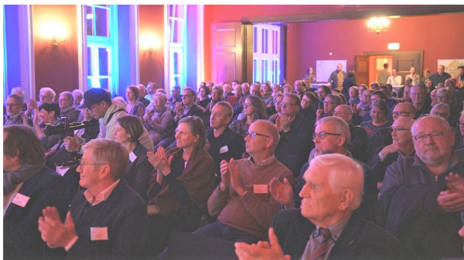
Die Werkstattwoche im November 2019 wurde von vielen interessierten Bürgerinnen und Bürgern besucht. Selbstverständlich auch von Mitgliedern des Bürgervereins.

Mehr als 70 Teilnehmer waren der Einladung im Gütersloher Theater gefolgt. Es wurde u.a. besprochen, wie das Quartier zu den umliegenden Siedlungen geöffnet werden kann, ohne die kleineren Siedlungsstraßen zu überlasten. Weitere Themen waren Anbindung an Verler Straße und Innenstadt, Mobilitätskonzepte, Einbindung eines Bildungscampus u.v.m.