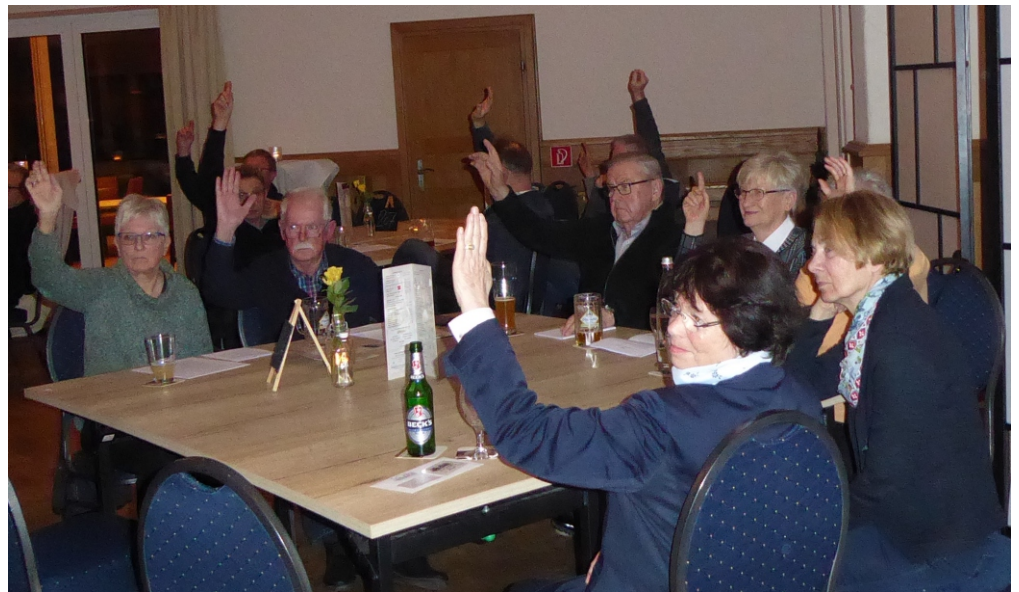
Abstimmung per Handzeichen: Einstimmig wurde die Satzung von den Teilnehmern der Jahreshauptversammlung beschlossen.

Den Anwesenden wurde nun die neue Satzung zur Entscheidung vorgelegt, die jedes Mitglied im Vorfeld zur Kenntnisnahme und Prüfung erhalten hatte. Die Satzung löst diejenige Fassung ab, die noch aus dem Jahr 1987 stammt und in maßgebenden Punkten nicht mehr zeitgemäß ist. Kernpunkt der neuen Vereinssatzung ist die Eintragung beim Amtsgericht als eingetragener Verein (e.V.)