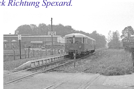
Bild oben links die Haltestelle Sunderweg neben dem Gelände von Draht-Wolf und Wetterschutzhäuschen auf dem heutigen Lidl-Parkplatz. Auf der anderen Seite der Sundernstraße der weitere Teil der Haltestelle zwischen Schrottplatz Lienke und Draht-Wolf (Bild oben rechts) Beide Firmen verfügten über einen Gleisanschluss.